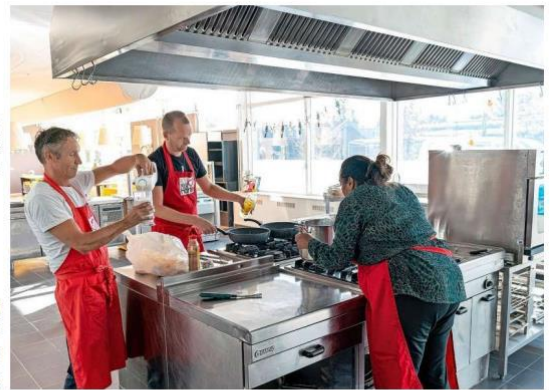
Koken door vrijwilligers in wijkcentrum De Rekere.

De Rekere verhuurt op de huidige plek ook ruimte aan derden, zoals de GGZ, Straatgeluid en de Klas op Wielen: de school voor meervoudig