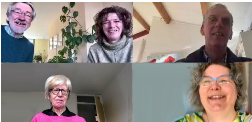
Foto screenshot van een online vergadering

In 2020 bestond de werkgroep van ATT uit: